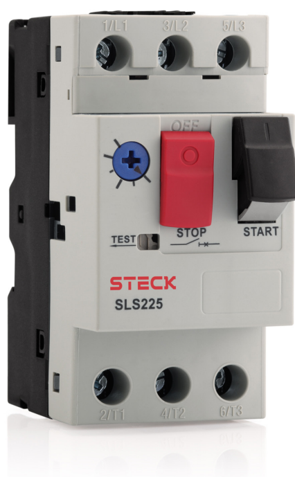
Disjuntor motor termomagnético SLS225-80 (AC)

Disjuntores termomagnéticos adaptados para a proteção e o comando de motores, normalmente utilizados em conjunto com um contator conduzindo em condições normais e interrompendo correntes em condições anormais (curto-circuito e sobrecarga). Permitem o arranque de motores com tensão plena, proteção contra sobrecargas e curtos-circuitos, não necessitando de fusíveis ou interruptores adicionais. A proteção contra a falta de fase e sobrecargas é assegurada por relé térmico acoplado. A frequência de manobras é função do contator, e as ligações mecânicas/elétricas do contator com o disjuntor garantem um conjunto compacto, facilitando a interligação elétrica e a montagem em caixas. O acionamento manual do disjuntor motor é feito pelos botões frontais, e a corrente térmica é regulada no botão de ajuste. As peças energizadas são inacessíveis ao toque, garantindo a proteção do operador (IP2XX).